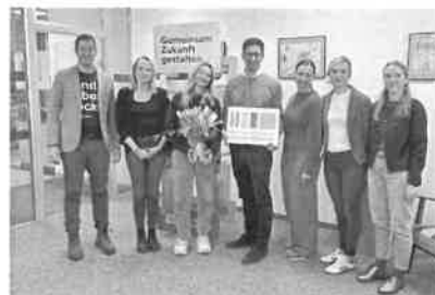
Das Team der Regionalentwicklung Oststeiermark